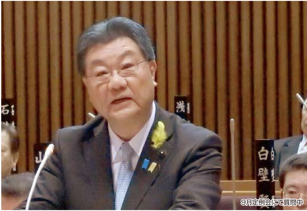
9月定例会にて質問中