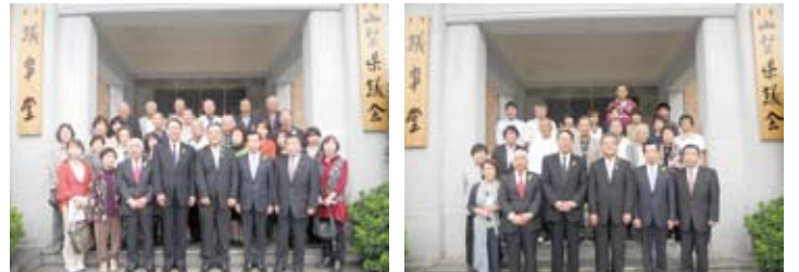
9月25日議会傍聴いただいた皆様(1班、2班)