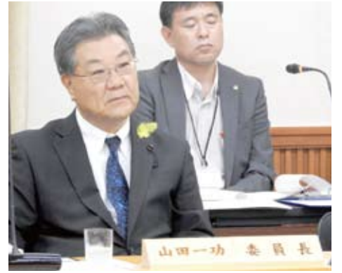
9月29日(火) 教育厚生委員会