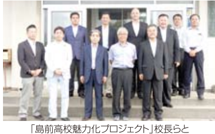
「島前高校魅力化プロジェクト」校長らと