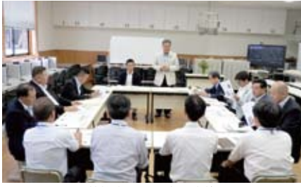
若桜学園での意見交換

9月1日(火)～3日(木)まで鳥取県若桜学園 隠岐島(島根県)島前高校他視察を行いました。