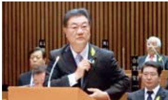
北方領土返還のバッジを見せながら発言