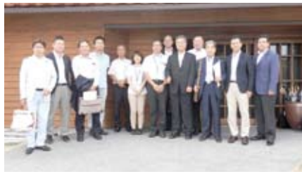
9月2日(水) 海士町・隠岐国学習センター前にて