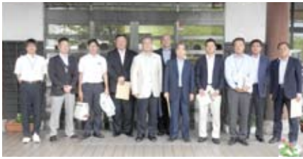
9月1日(火) 小中一貫校若桜学園視察(鳥取県)