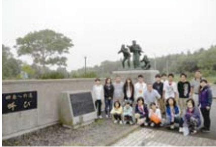
別海町 展望台・望郷の叫び